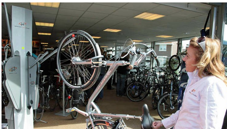
Met een hand uw fiets stallen.

Zodra de fiets in de wielgoot staat, staat uw fiets veilig in het rek. Of beter gezegd: hangt hij aan het rek, waardoor het minder ruimte opeist. De fiets weer van het rek halen is net zo makkelijk. Opnieuw pakt u de fiets bij het stuur en zadel vast. Door de fiets van de muur af te trekken, komt de arm in beweging en zal de fiets weer netjes naar de grond begeleiden. Nadat de klik weer geklonken heeft, is de fiets beneden en kunt u uw fiets weer meenemen.